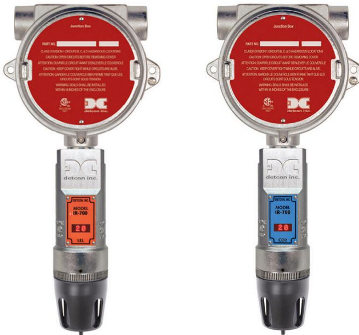
Рисунок 1 - Газоанализаторы стационарные оптические IR-700 (с монтажной коробкой)

Внешний вид газоанализаторов приведен на рисунках 1. В зависимости от комплектации (например, вид монтажной коробки, наличие RAM и HART-модулей, защиты от внешних воздействующих факторов, адаптера для подачи ГС и др.) внешний вид может изменяться.