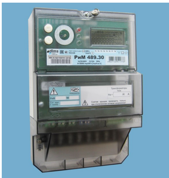
Рисунок 1 – Общий вид счетчика

Схема пломбировки от несанкционированного доступа, обозначение места нанесения знака поверки представлена на рисунке 2.