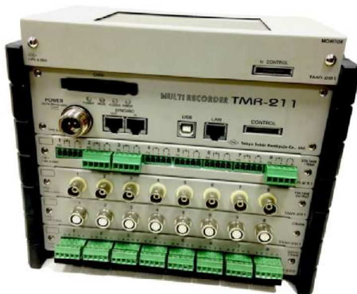
Рисунок 1 - Общий вид усилителей измерительных многоканальных TMR-211

На рисунке 2 отмечены места размещения пломбирующих наклеек.