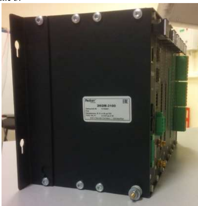
Рисунок 1 - Общий вид УСПД ЭКОМ-3100

Фотография общего вида УСПД ЭКОМ-3100 приведена на рисунке 1. Знак поверки в виде наклейки наносят на поверхность корпуса, как показано на рисунке 2. Для защиты от несанкционированного доступа УСПД ЭКОМ-3100 опечатывают пломбами, как показано на рисунке 3.