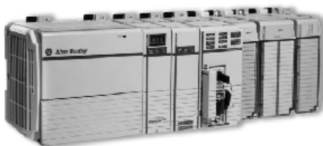
Рисунок 3 - Фотография контроллера CompactLogix (серия 1769)