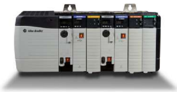
Рисунок 2 - Фотография контроллера ControlLogix (серия 1756)