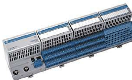
Рисунок 5 - Фотография модулей ввода/вывода Flex Ex (серия 1797)