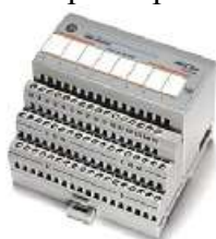
Рисунок 4 - Фотография модулей ввода/вывода Flex I/O (серия 1794)