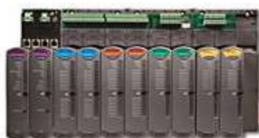
Рисунок 7 - Фотография модулей ввода/вывода Redundant I/O (серия 1715)