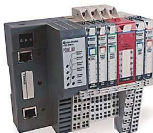
Рисунок 6 - Фотография модулей ввода/вывода Point I/O (серия 1734)