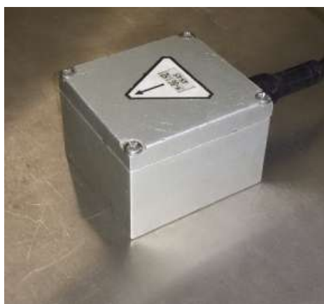
Рисунок 1а - Первичный преобразователь

Регистратор оснащён сенсорной шестиклавишной панелью и жидкокристаллическим дисплеем. На боковой стенке регистратора расположены разъёмы для подключения первичного преобразователя и зарядки аккумуляторной батареи. Также в регистраторе предусмотрена возможность сохранения результатов измерений на ПК. Внешний вид регистратора приведён на рисунке 1б.