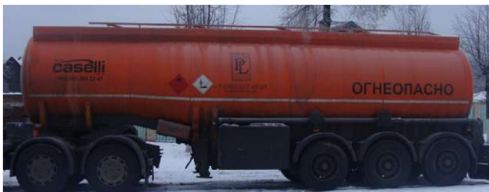
Фото 1 - Общий вид полуприцепа-цистерны CASELLI DMD012

На боковых сторонах и сзади ППЦ имеет надпись «ОГНЕОПАСНО», знак ограничения скорости и знаки с информационными табличками для обозначения транспортного средства, перевозящего опасный груз.