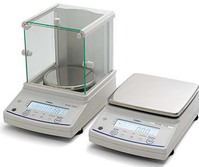
Рисунок 1 – Общий вид весов неавтоматического действия АВ

Принцип действия весов основан на преобразовании частоты вибрации акустического весоизмерительного датчика, возникающей при его деформации под действием взвешиваемого груза, в цифровой электрический сигнал, изменяющийся пропорционально массе взвешиваемого груза. Результаты взвешивания выводятся на дисплей.