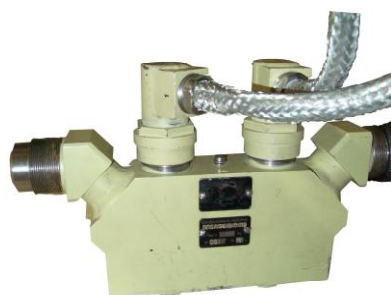
Рисунок 2 - Внешний вид преобразователя первичного осевого ППО-А