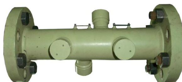
Рисунок 3 - Внешний вид преобразователя первичного осевого ППОТ-К