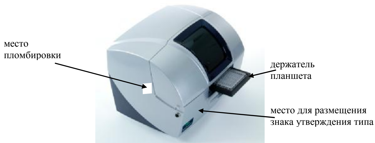
Рисунок 3 - Внешний вид, обозначение места для размещения знака утверждения типа и схема пломбировки от несанкционированного доступа анализаторов Zetasizer APS