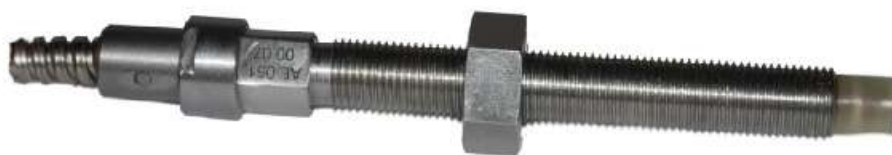
а) первичный преобразователь AE051