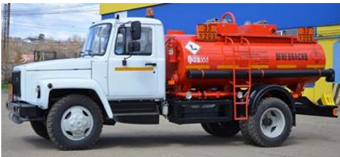
Рисунок 1 - Общий вид автоцистерны АЦ и автотопливозаправщика АТЗ модель 4389

Фотография общего вида АЦ (АТЗ) представлена на рисунке 1, узел выдачи топлива (УВТ) представлен на рисунке 2, место пломбирования на рисунке 3.