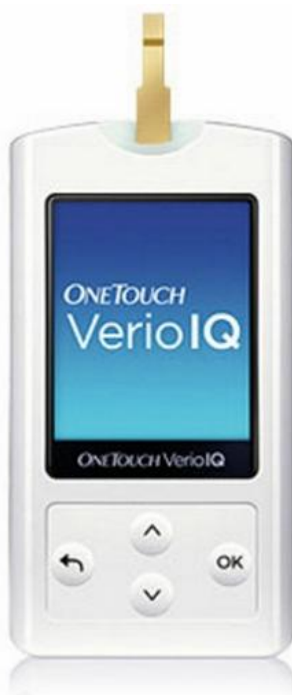
Рисунок 1 – Общий вид глюкометра OneTouch Verio IQ

Принцип действия глюкометров основан на измерении потенциала электрического тока, вызванного реакцией глюкозы в образце крови с ферментом глюкозооксидазы при измерении концентрации глюкозы. Измеренный потенциал электрического тока пропорционален концентрации глюкозы в анализируемой пробе крови. Результат измерения обрабатывается микропроцессорным устройством и отображается на экране встроенного жидкокристаллического дисплея в единицах ммоль/л, а также записывается в памяти приборов.