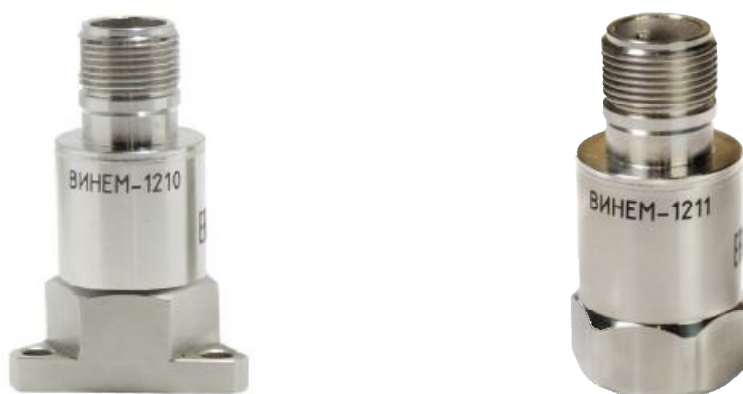
Рисунок 3 – Внешний вид пьезоэлектрических датчиков ВИНЕМ-1210 и ВИНЕМ-1211