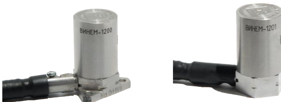
Рисунок 2 – Внешний вид пьезоэлектрических датчиков со встроенной электроникой (IEPE) с выходом по напряжению ВИНЕМ-1200 и ВИНЕМ-1201

Внешний вид первичных измерительных преобразователей приведен на рисунках 2-4.