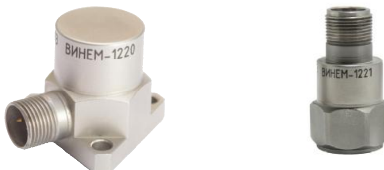
Рисунок 4 – Внешний вид пьезоэлектрических датчиков ВИНЕМ-1220 и ВИНЕМ-1221