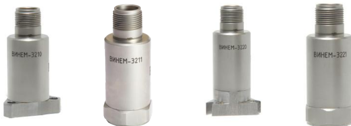
Рисунок 5 - Внешний вид преобразователей измерительных параметров абсолютной вибрации ВИНЕМ-3210, ВИНЕМ-3211, ВИНЕМ-3220 и ВИНЕМ-3221

Внешний вид преобразователей измерительных параметров абсолютной вибрации ВИНЕМ-3210, ВИНЕМ-3211, ВИНЕМ-3220 и ВИНЕМ-3221 приведен на рисунке 5.