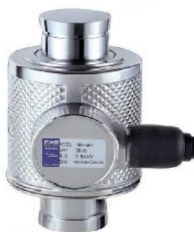
WBK (CAS) № 56685-14