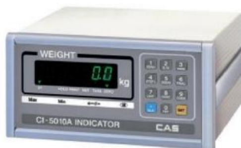
CI-5010A № 50968-12