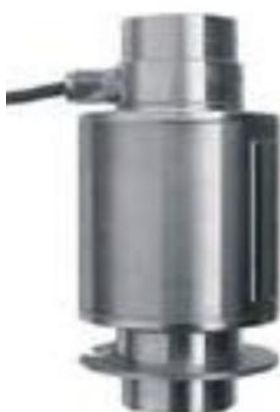
ZSFY (KELI) № 57674-14