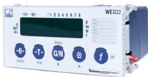
WE2111 (HBM) № 61808-15