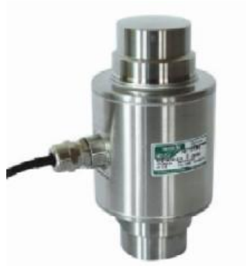
MB150 (Тензо М) № 44780-10