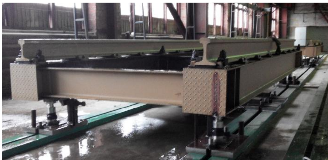
Рисунок 1 - Внешний вид весов ВВС

Внешний вид весов и составных элементов, а также вид маркировочной таблички представлены на рисунках 1-4.