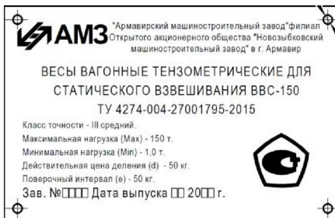
Рисунок 4 - Внешний вид маркировочной таблички