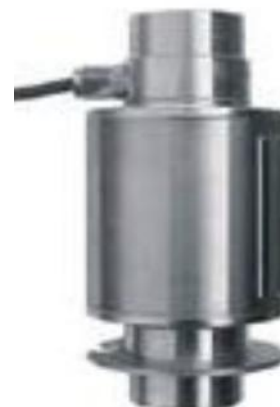
SBM14K (ZEMIC) № 55917-13