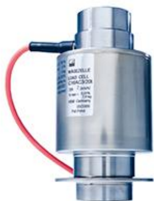
C16A (HBM) № 60480-15