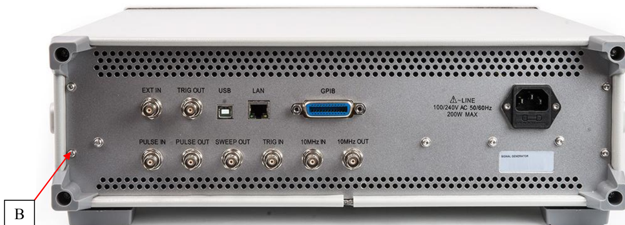
Рисунок 2 – Вид задней панели генераторов с указанием места пломбировки от несанкционированного доступа (В)