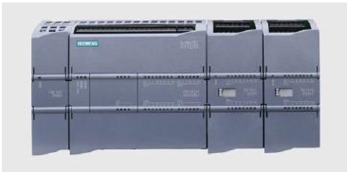
Рисунок 1 - Общий вид контроллеров