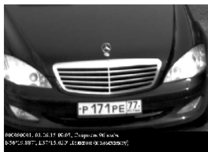
Рисунок 2 - Кадр фотофиксации, с внесенными обязательными данными о результатах измерений, заводском номере АПК, дате и месте установки