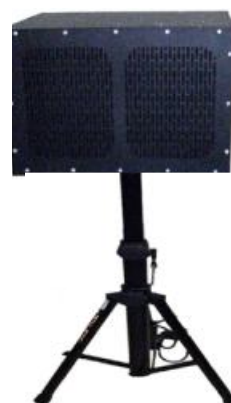
Экранированная акустическая система