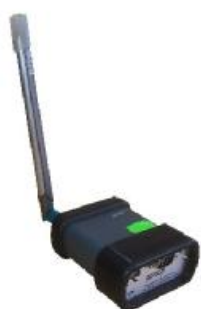
Устройство сопряжения с измерительным модулем «S8W»