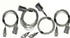
Комплект ПИП виброускорения