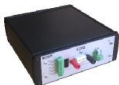
Источник электропитания ВТСС «SZPS»