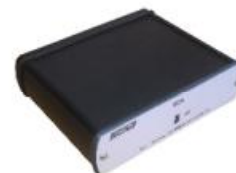
Внешний аккумулятор модуля сопряжения с ПК