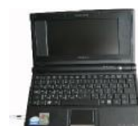
Модуль источника тестового акустического сигнала