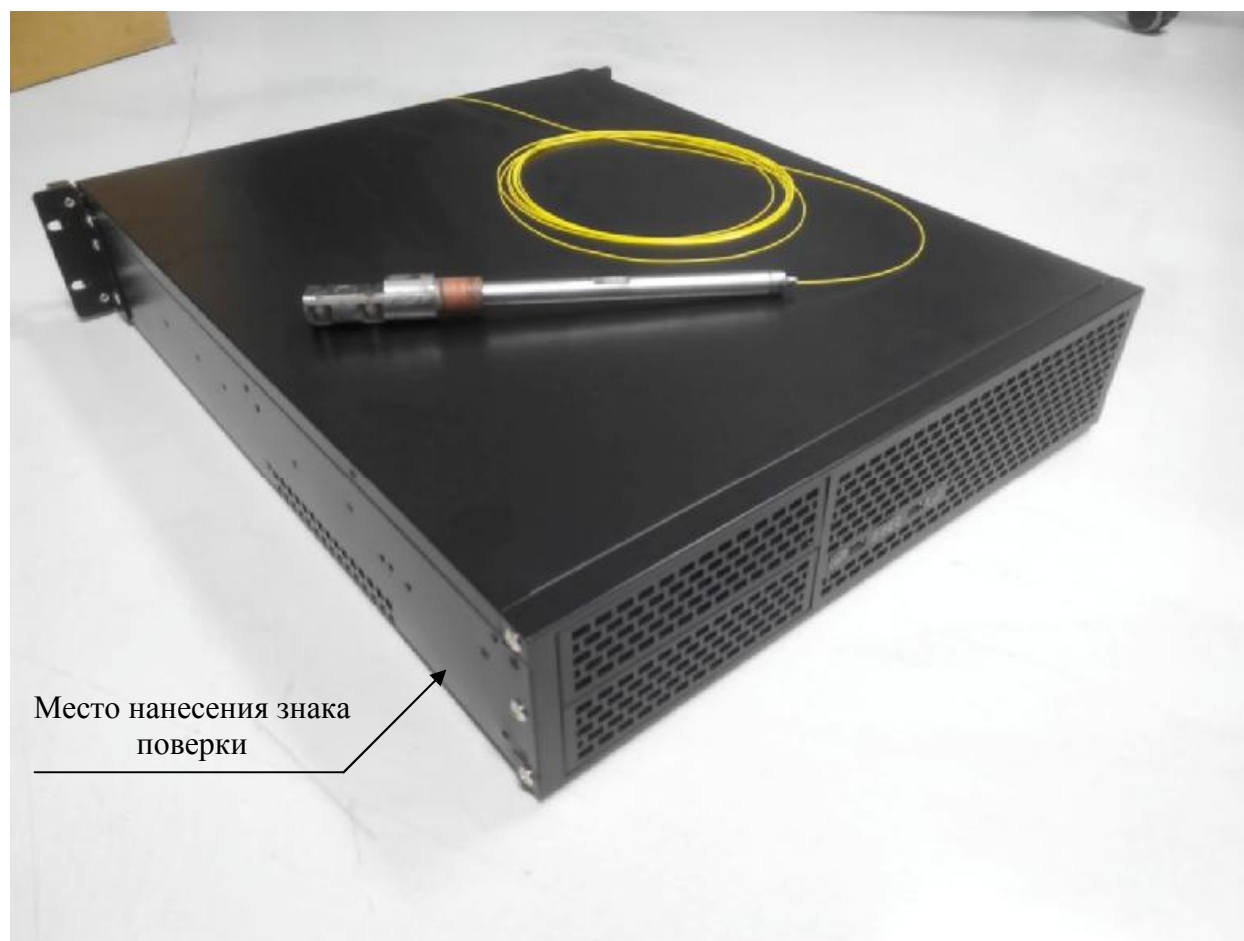
Рисунок 3 - Внешний вид системы ВОСК-Р/Тм с указанием места нанесения знака поверки