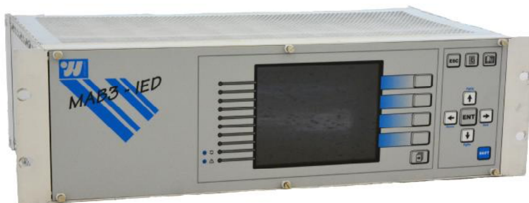
Рисунок 1 – Общий вид контроллера спереди