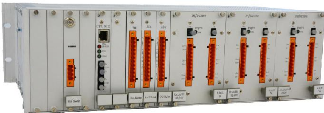
Рисунок 2 – Общий вид контроллера сзади