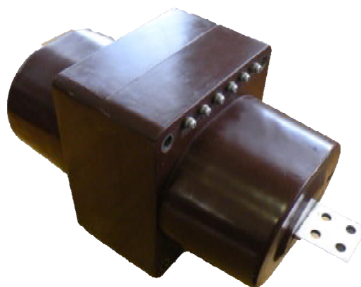
Рисунок 1 – Общий вид трансформаторов тока ТПОЛ-К-10 У2

Общий вид трансформаторов приведен на рисунке 1. Схема пломбирования и место нанесения знака поверки приведены на рисунке 2.