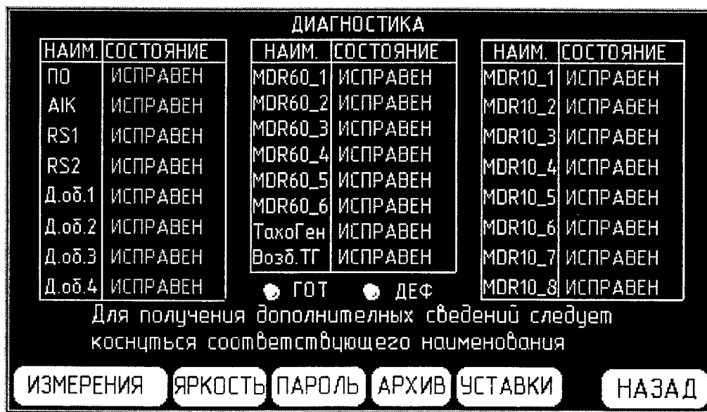
Рисунок 2 – Изображение на экране панели оператора после ввода пароля

Ввести заводской пароль «0», «0», «0», «0», «Ent» с клавиатуры в нижней строке экрана, предварительно кратковременно коснувшись области экрана внутри зеленой рамки. Изображение на экране должно смениться приведённым на рисунке 2.