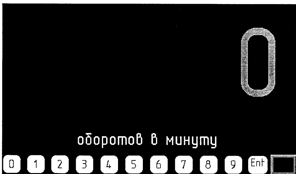
Рисунок 1 – Изображение на экране панели оператора

Ввести заводской пароль «0», «0», «0», «0», «Ent» с клавиатуры в нижней строке экрана, предварительно кратковременно коснувшись области экрана внутри зеленой рамки. Изображение на экране должно смениться приведённым на рисунке 2.