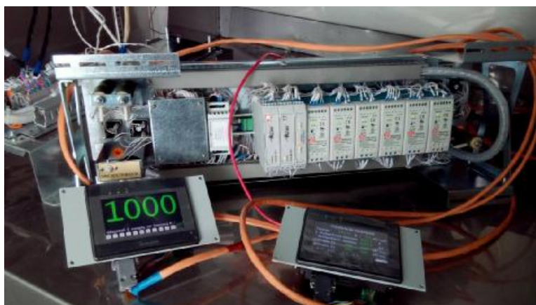
Рисунок 1 – Внешний вид комплектов блоков преобразователей, контроля и индикации КБП-1

Внешний вид комплектов представлен на рисунке 1.