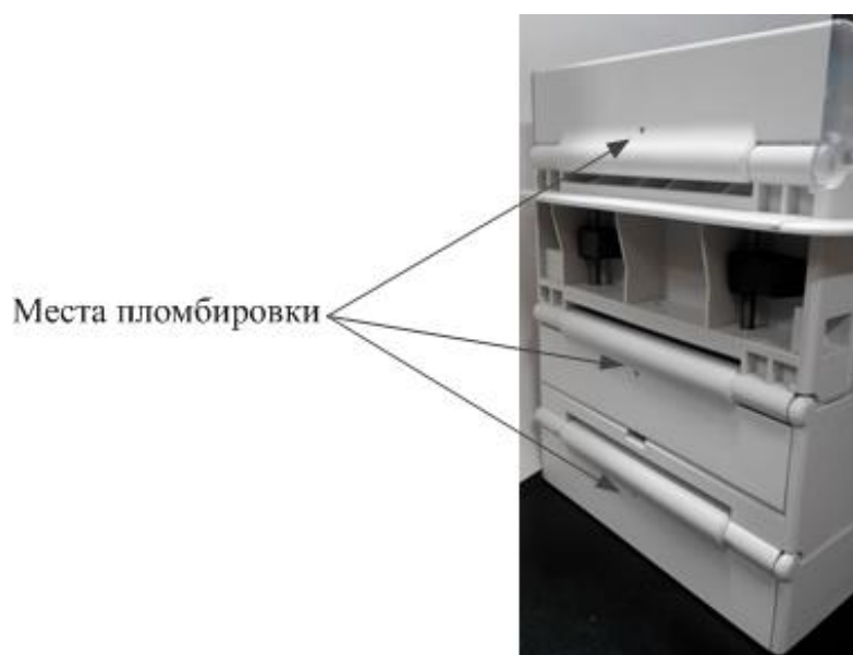
Рисунок 3 – Схема пломбировки АБАК ПЛК в корпусе корзинного вида