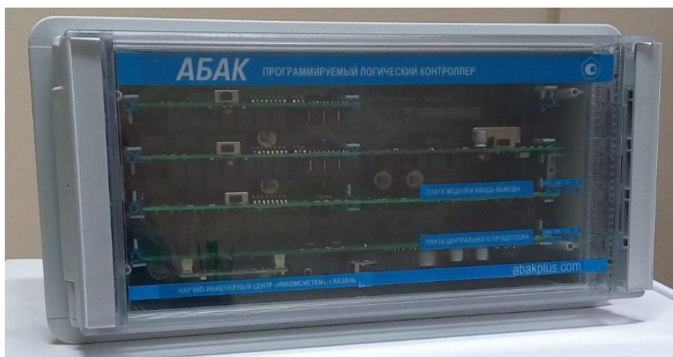
Рисунок 1 – Общий вид АБАК ПЛК в корпусе корзинного вида (отдельная корзина)

Общий вид АБАК ПЛК представлены на рисунках 1 и 2.