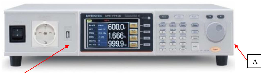
Источники APS-77050, APS-77100