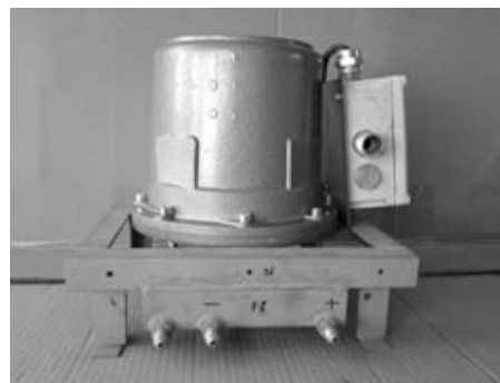
б) без кожуха