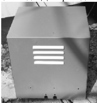
а) с кожухом