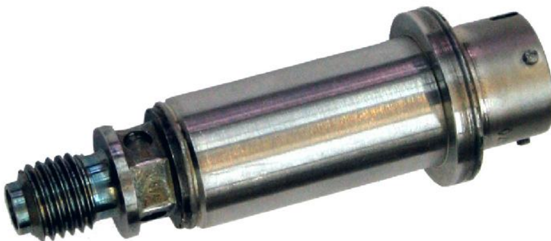
Рисунок 1 - Общий вид датчиков ДДА

Габаритно-установочные размеры датчиков ДДА приведены на рисунке 2.