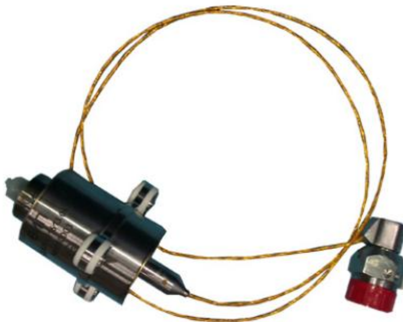
Рисунок 1 - Общий вид датчика

Общий вид датчика приведен на рисунке 1, габаритно-установочные размеры - на рисунке 2, схема пломбирования от несанкционированного доступа – на рисунке 3.