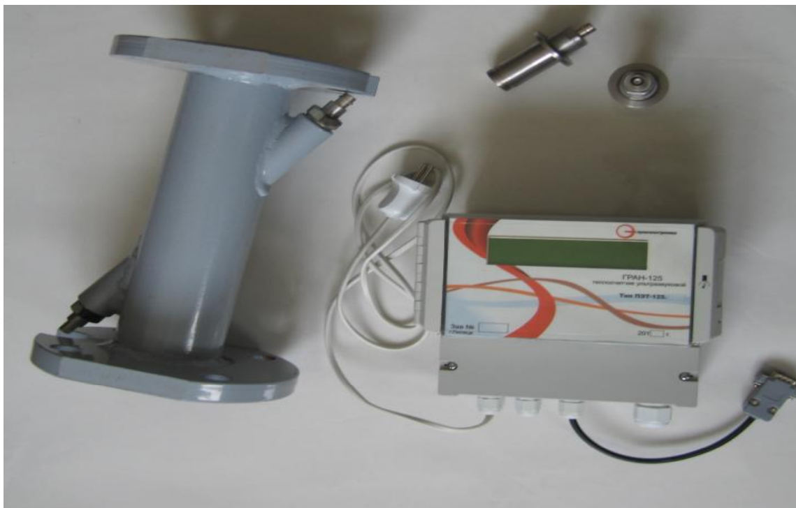
Рисунок 1-Общий вид теплосчетчика

Общий вид теплосчетчиков приведен на рисунке 1.