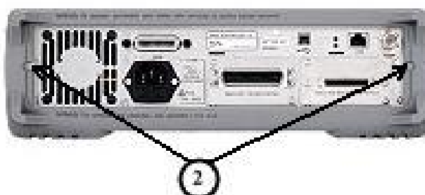
Примечание: ② - места пломбировки от несанкционированного доступа. Рисунок 8 – Измеритель RLC (модель E4980А). Вид сзади