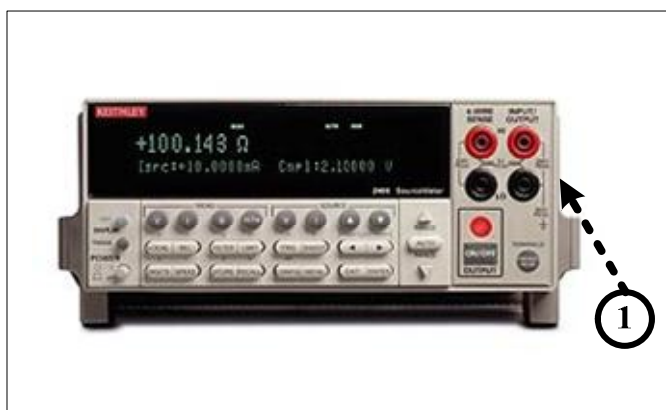
Рисунок 1 – Управляющая ПЭВМ. Вид спереди

Примечание: ① - место для размещения наклеек (знака поверки и знака утверждения типа)