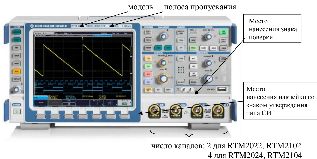
Рисунок 1- Внешний вид осциллографов цифровых запоминающих RTM2022, RTM2024, RTM2102, RTM2104

Схема пломбировки от несанкционированного доступа и обозначение мест для размещения наклеек приведены на рисунке 2.