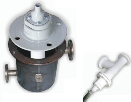
Рисунок 3 – Индукционный первичный измерительный преобразователь