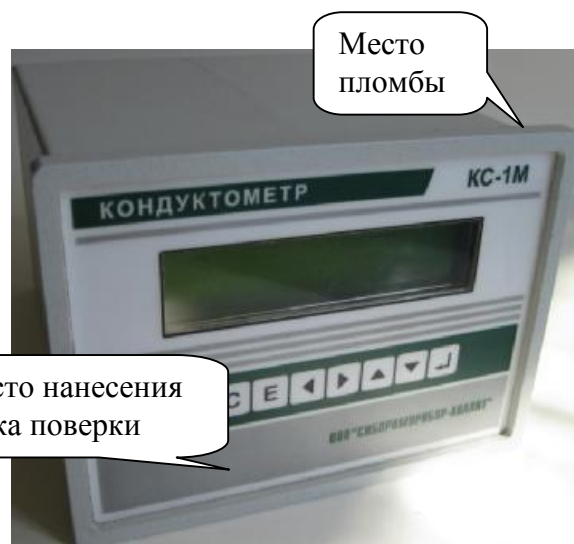
Рисунок 2 – Измерительный блок