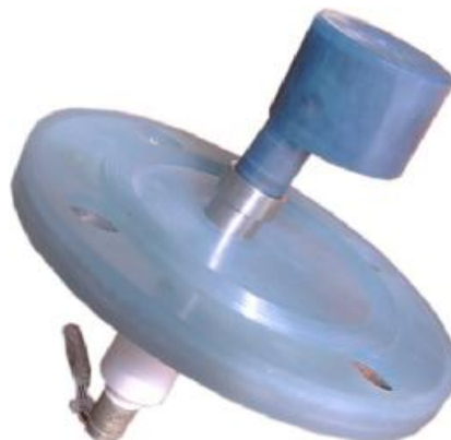
Рисунок 4 – Трансформаторный первичный измерительный преобразователь