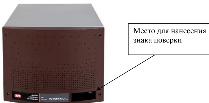
Рисунок 1 - Внешний вид анализатора модели PIONIR MVP+

Место для нанесения знака поверки находится на корпусе анализатора (в случае, если условия эксплуатации прибора не обеспечивают сохранность знака поверки в течение всего межповерочного интервала допускается наносить знак поверки на свидетельство о поверке).