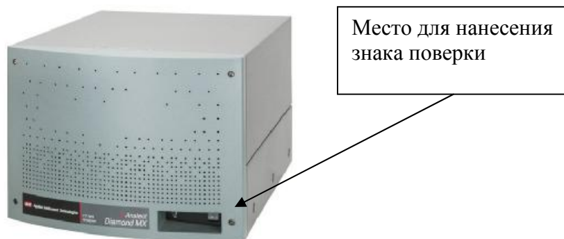
Рисунок 3 - Внешний вид анализаторов модели Diamond MX