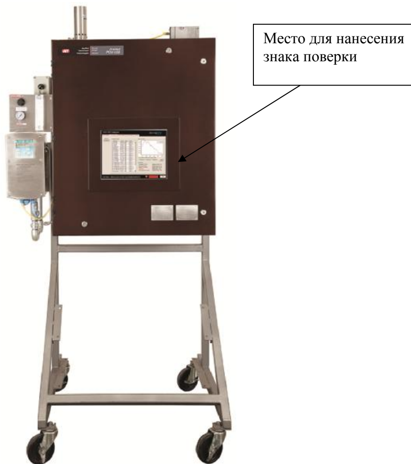
Рисунок 5 - Внешний вид анализатора модели РСМ 1000 и РСМ 5000