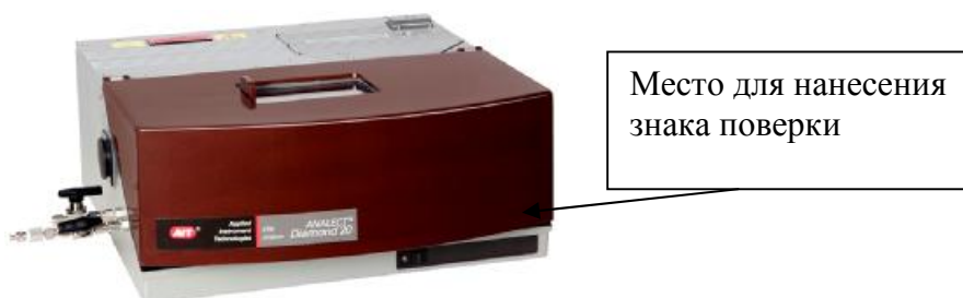
Рисунок 4 - Внешний вид анализаторов модели Diamond 20