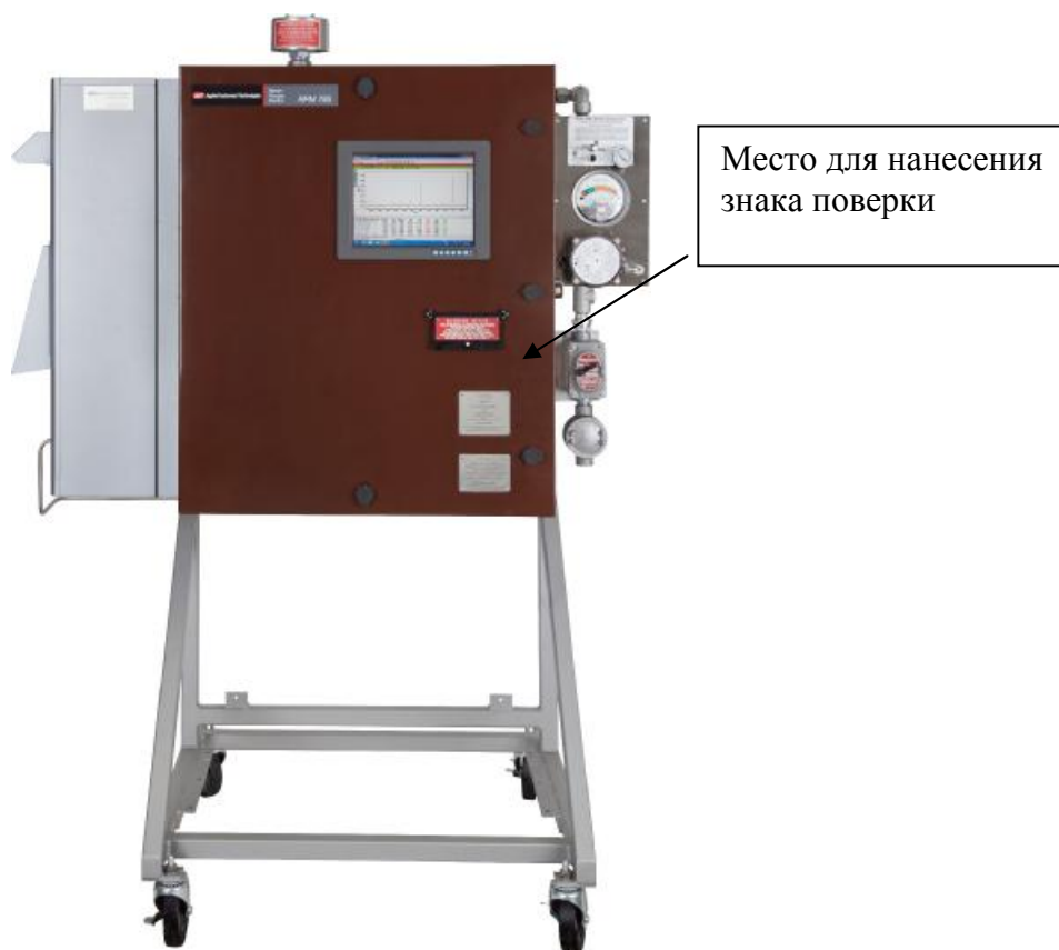
Рисунок 2 - Внешний вид анализатора модели PIONIR 1024