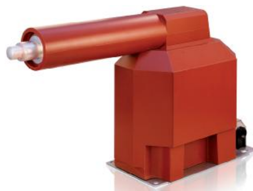
Рисунок 2 – Внешний вид трансформаторов напряжения ТЈР 6.0