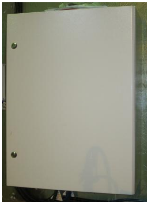
Рисунок 1 – Фотографии общего вида анализатора жидкости А15/79

Внутри аналитического блока расположены реакционная ячейка с мембранным электрохимическим датчиком, два насоса для подачи в ячейку пробы и реагентов. Проба из проточной камеры по пластиковым трубкам поступает в реакционную камеру аналитического блока, туда же поступают реагенты, далее в кислой среде происходит химическая реакция активного хлора с иодидом калия с выделением эквивалентного количества свободного иода.