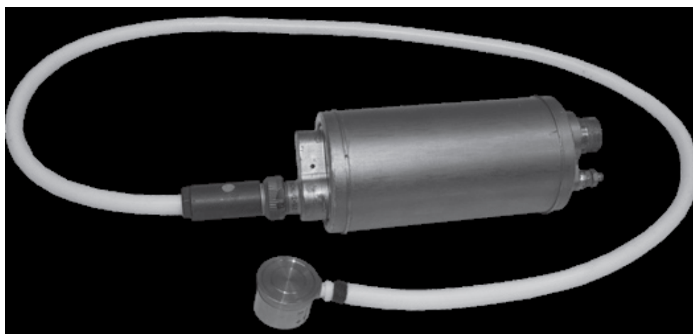
Рисунок 1 – Общий вид датчика

Схема пломбирования от несанкционированного доступа представлена на рисунке 3. Крышка на блоке электронного опломбирована металлической пломбой (с проволокой) от несанкционированного вмешательства в процессе транспортировки и хранения. На соединение вибропреобразователя с блоком электронным также имеется металлическая пломба (с проволокой) для предотвращения несанкционированной настройки и вмешательства в процессе эксплуатации, которые могут привести к искажению результатов измерений.