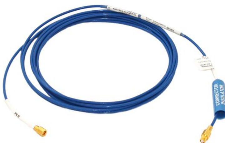
Рисунок 3 – Внешний вид удлинительного кабеля MX2031