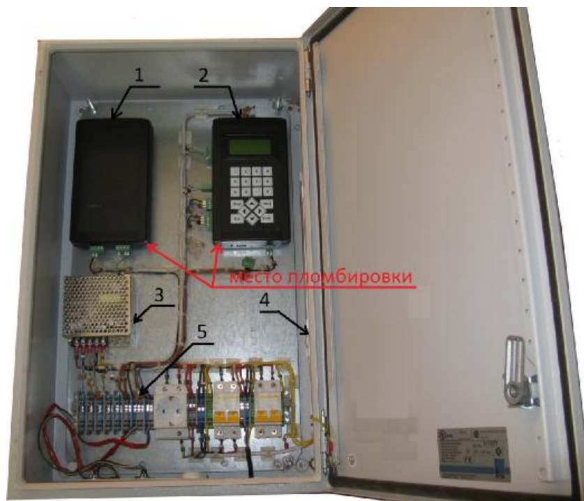
Рисунок 1 – Внешний вид блока измерительного ИС-14 1 – вычислитель; 2 – контроллер ИС-14; 3 – источник питания; 4 – лампа освещения; 5 – клеммная колодка.