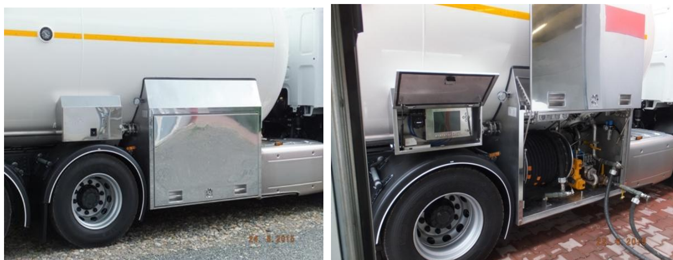
Рисунок 2 - Установка «Corio T» раздельного исполнения, размещённая на транспортном средстве