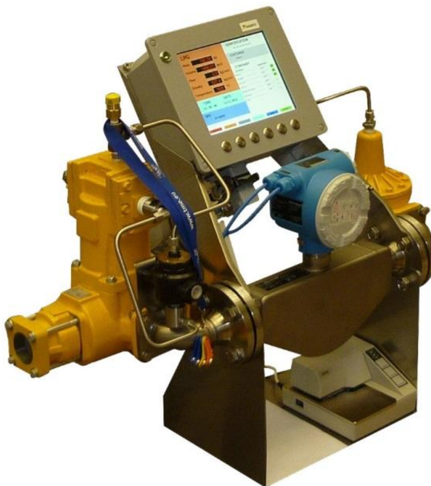
Рисунок 1 – Установка «Corio T» моноблочного исполнения