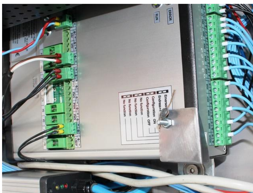
Рисунок 4 - Место пломбирования защитной крышки платы вычислителя