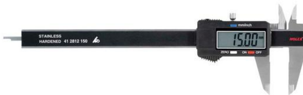
Рисунок 5 – Общий вид штангенциркулей цифровых Horex модификации 412812