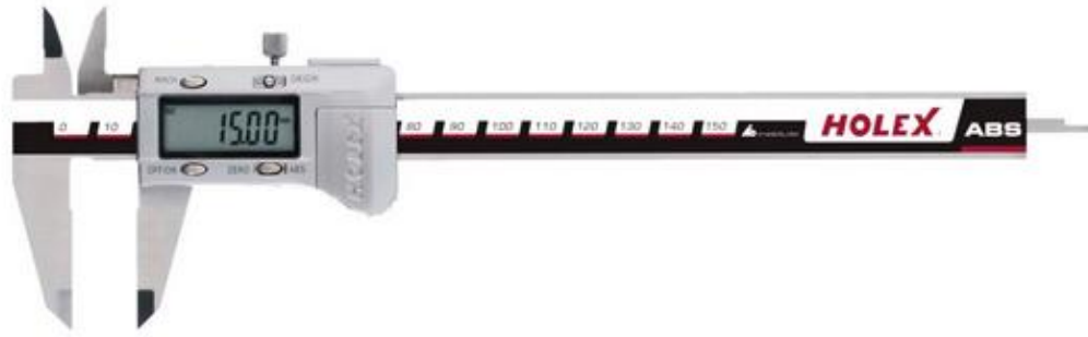
Рисунок 2– Общий вид штангенциркулей цифровых Horex модификации 412805