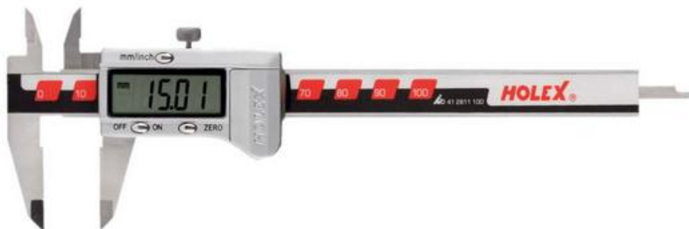
Рисунок 4 – Общий вид штангенциркулей цифровых Horex модификации 412811