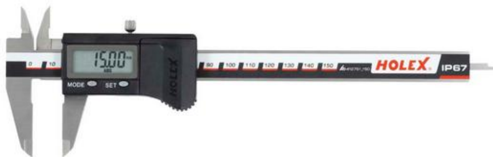
Рисунок 1 – Общий вид штангенциркулей цифровых Horex модификации 412751

Штангенциркули изготавливаются из нержавеющей стали.