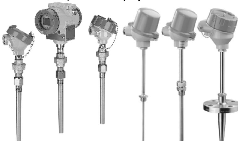
Рисунок 1 – Общий вид термопреобразователей

Фотографии общего вида ТС приведены на рисунках 1 и 2.