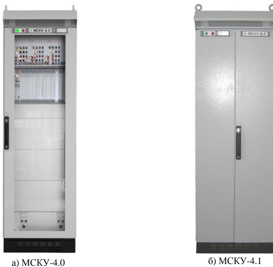
Рисунок 1 – Общий вид комплекса

Общий вид комплекса представлен на рисунке 1. Схема защиты от несанкционированного доступа представлена на рисунке 2.