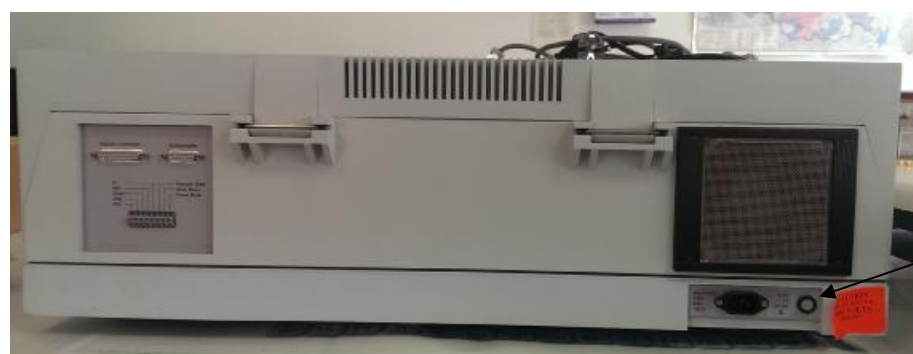
Рисунок 3 – Место пломбирования спектрометров люминесцентных LS 45 и LS 55 (вид сзади)