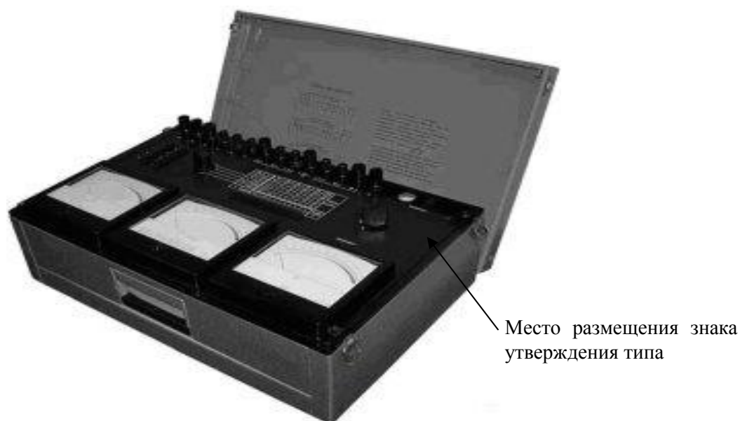
Рисунок 2 - Общий вид комплекта