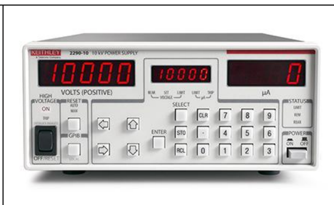
Рисунок 2 – Передняя панель модели 2290-10

место размещения знака утверждения типа и знака поверки