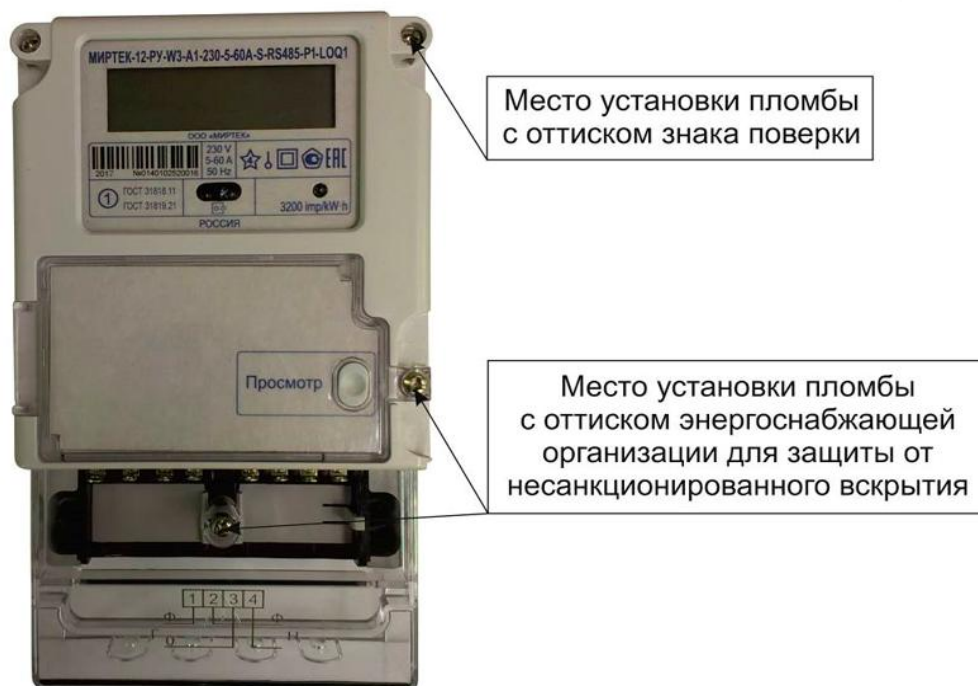
Рисунок 2 – Общий вид счетчика в корпусе типа W3