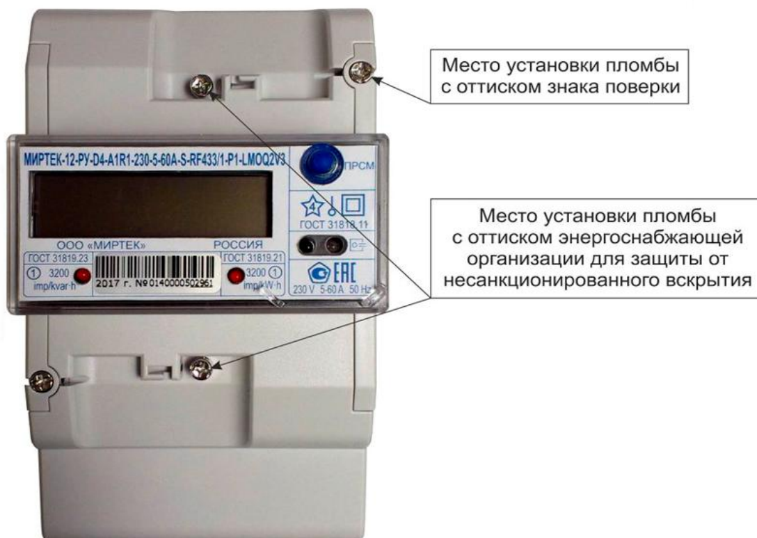
Рисунок 4 – Общий вид счетчика в корпусе типа D4