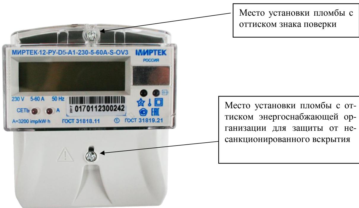
Рисунок 11 – Общий вид счетчика в корпусе типа D5