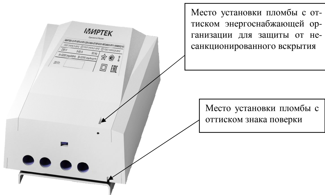
Рисунок 12 – Общий вид счетчика в корпусе типа SP2