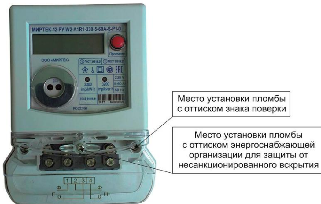
Рисунок 1 – Общий вид счетчика в корпусе типа W2