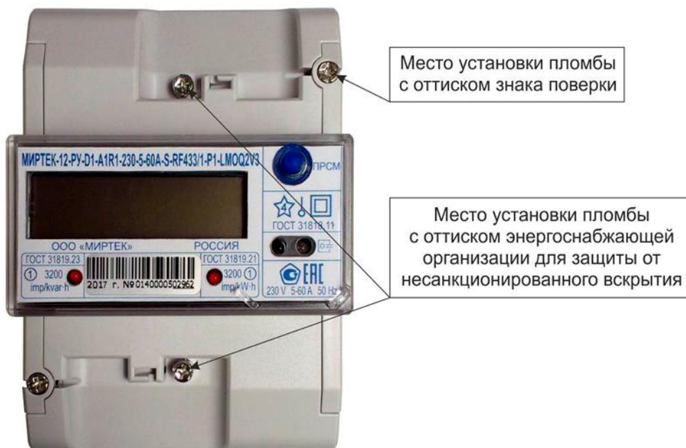
Рисунок 3 – Общий вид счетчика в корпусе типа D1