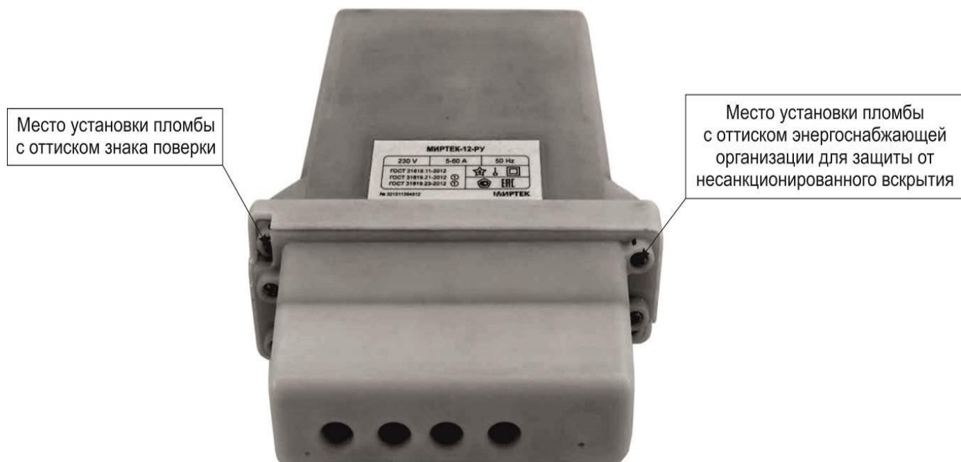
Рисунок 5 – Общий вид счетчика в корпусе типа SP1