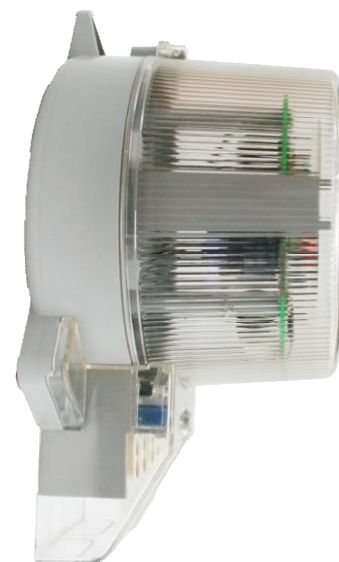
Рисунок 8 – Общий вид счетчика в корпусе типа W6

Место установки пломбы с оттиском знака поверки