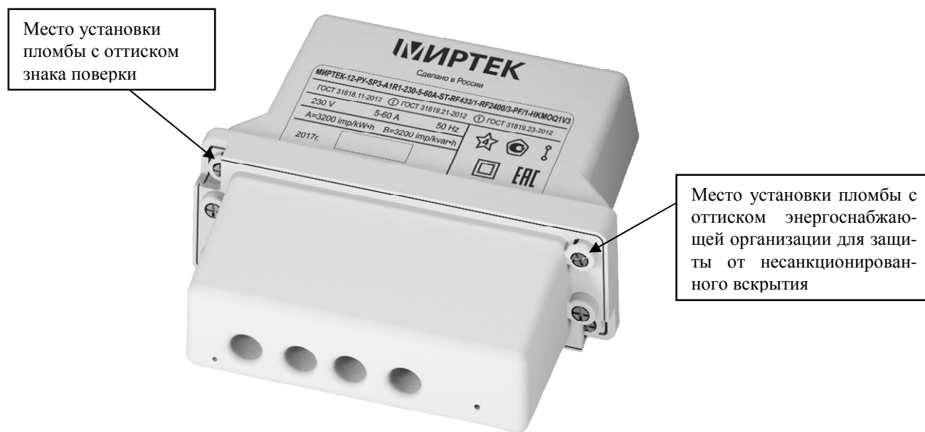
Рисунок 13 – Общий вид счетчика в корпусе типа SP3