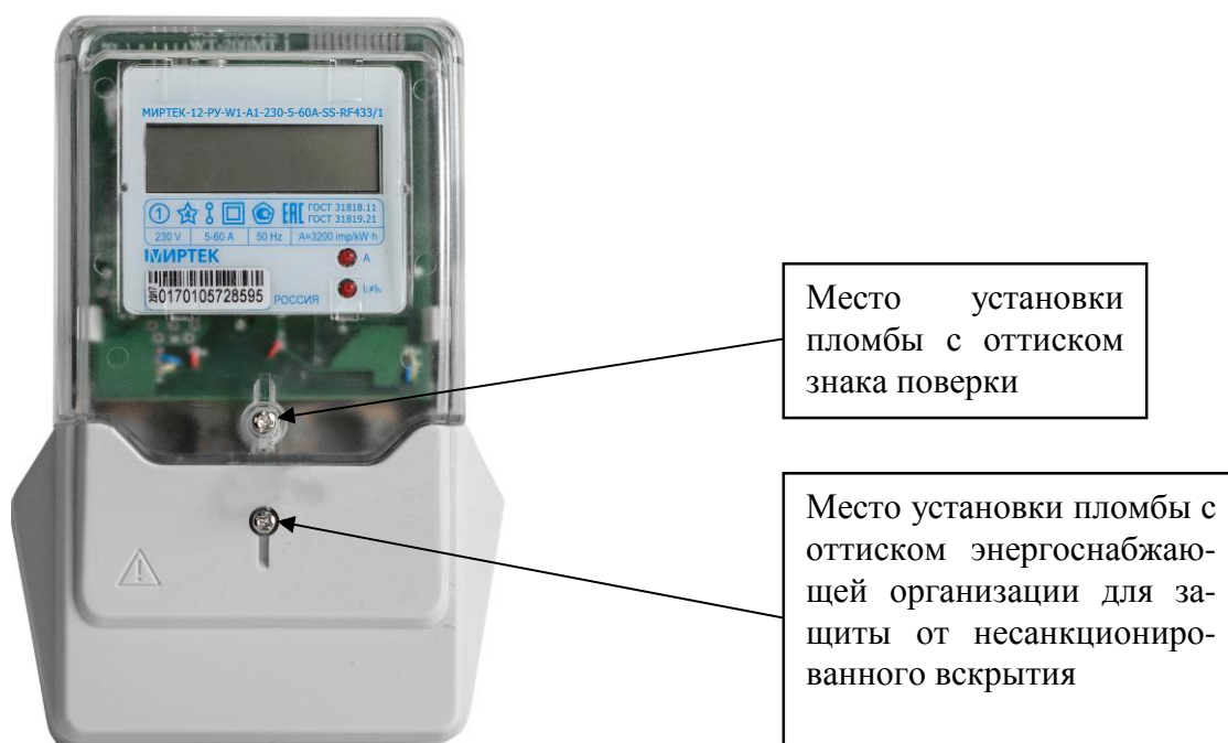
Рисунок 7 – Общий вид счетчика в корпусе типа W1