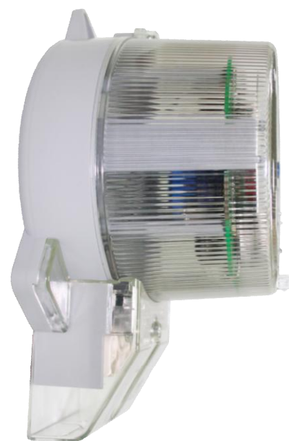
Рисунок 9 – Общий вид счетчика в корпусе типа W6b