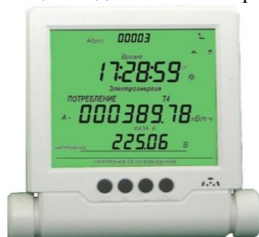
Рисунок 6 – Общий вид дистанционного индикаторного устройства