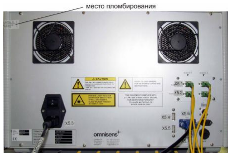
Рисунок 2 – Внешний вид анализатора (вид сзади) с указанием места пломбирования