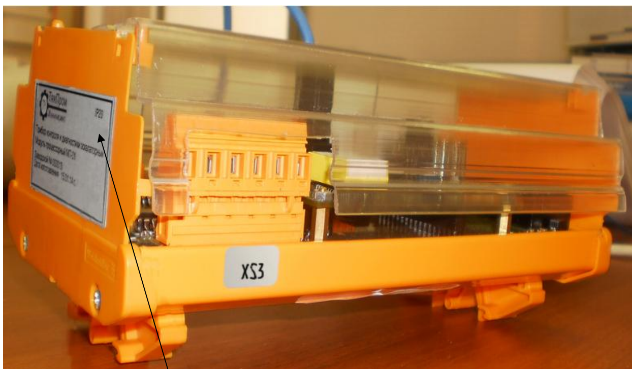
Место нанесения знака утверждения типа Рисунок 2 - Модуль микропроцессорный