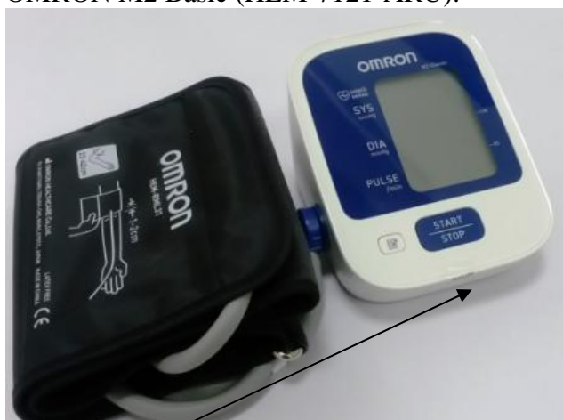
Место нанесения защитной наклейки.