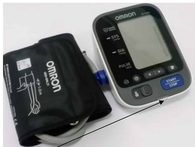
Место нанесения защитной наклейки.

Рисунок 7 – Измеритель артериального давления и частоты пульса автоматический OMRON M3 Expert (HEM-7132-ALRU).