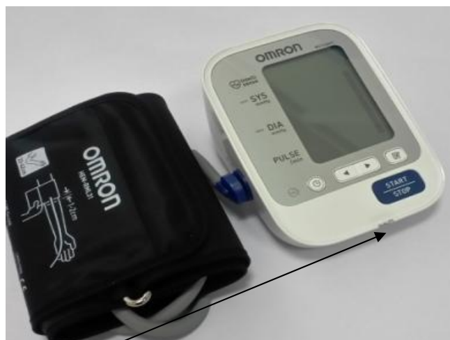
Место нанесения защитной наклейки.

Рисунок 7 – Измеритель артериального давления и частоты пульса автоматический OMRON M3 Expert (HEM-7132-ALRU).