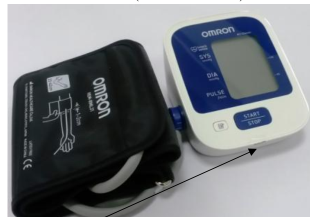
Место нанесения защитной наклейки.