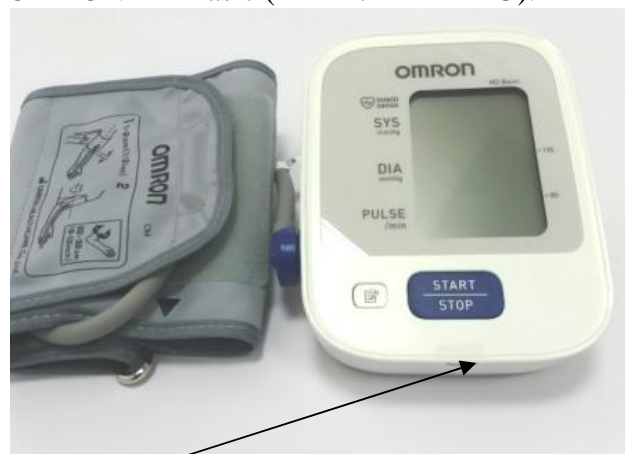
Место нанесения защитной наклейки.