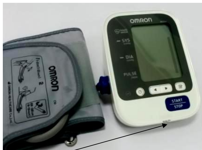
Место нанесения защитной наклейки.